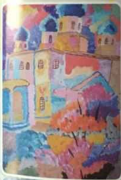
«Мой сказочный край», Зоя ПОГОДАЕВА, 14 лет, г. Красноярск