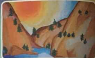
«Родные просторы», Мегаша ФОТИНА, 8 лет, с. Потапово

Журнал зарегистрирован и внесен в Единый федеральный реестр СМИ. Редакционный номер 01070/19-0000 Свидетельство о регистрации СМИ от 01.02.2019 № 01070/19-0000 Свидетельство о регистрации СМИ от 01.02.2019 № 01070/19-0000 Свидетельство о регистрации СМИ от 01.02.2019 № 01070/19-0000